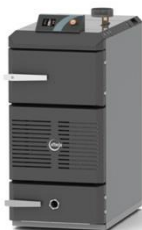
Alcon Effecta Lambda 35 (Varenr. KE 1350)

Dårlig isoleret hus = ca. 80 m 2 Mellem isoleret hus = ca. 160 m 2 Godt isoleret hus = ca. 210 m 2